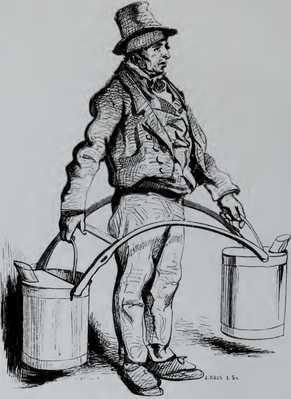
Le Porteur d'Eau.